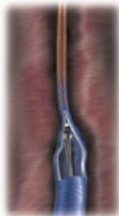
Catheter withdrawn, closing vein

Deze techniek vormt naast de SEPS techniek (endoscopische perforanten onderbinding) een belangrijke uitbreiding van ons therapeutisch gamma voor de behandeling van oppervlakkige veneuze insufficiëntie.