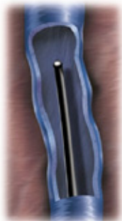
Disposable catheter inserted into vein