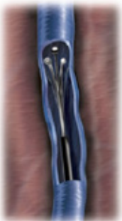
Vein warmed and collapses