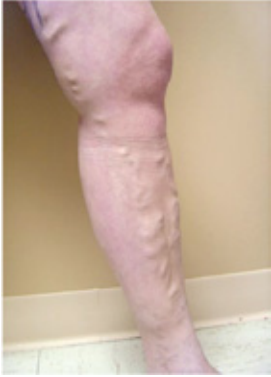
Voor de procedure